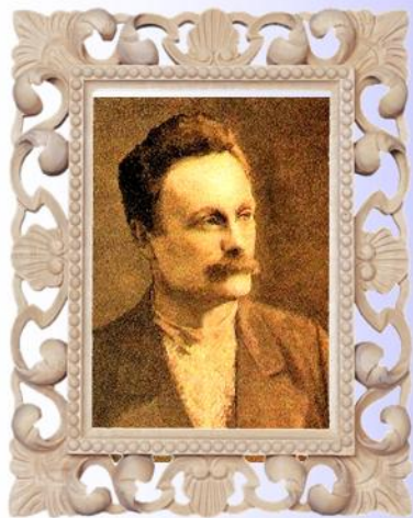
І.Я. Франко (1856-1916)